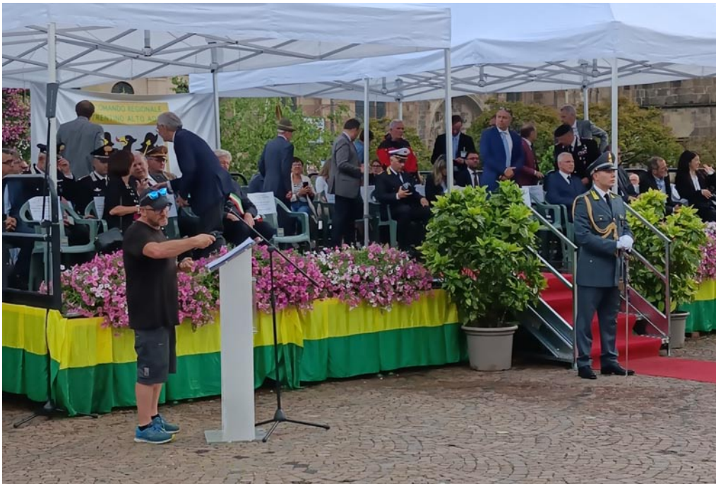
Il palco riservato alle Autorità