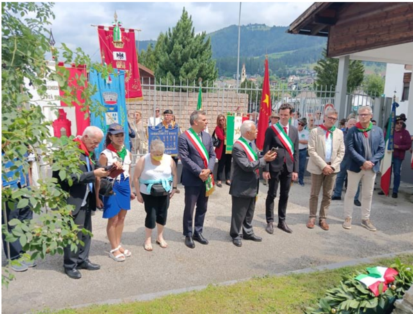
Le Autorità al momento della deposizione delle Quattro Corone e dei fiori