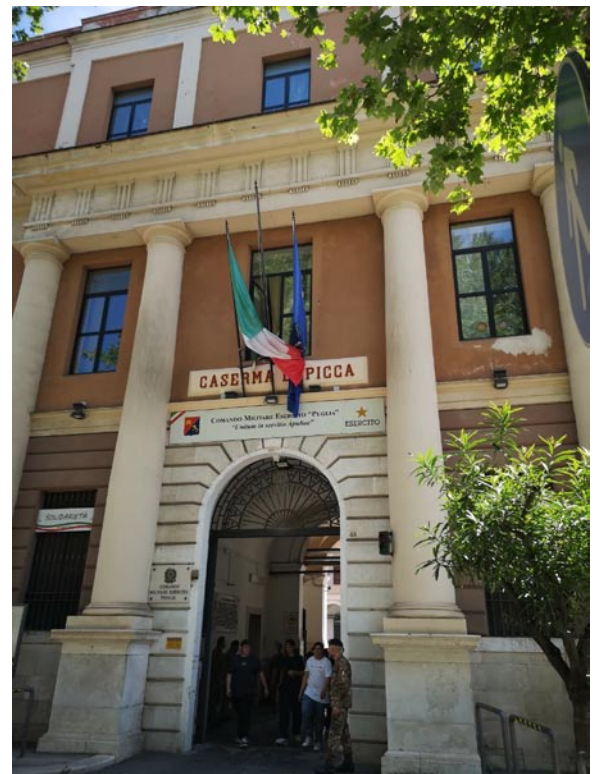
Bari, entrata della Caserma 'Picca' (non c'entra nulla con Bolzano, ma è architettura che mi piace)