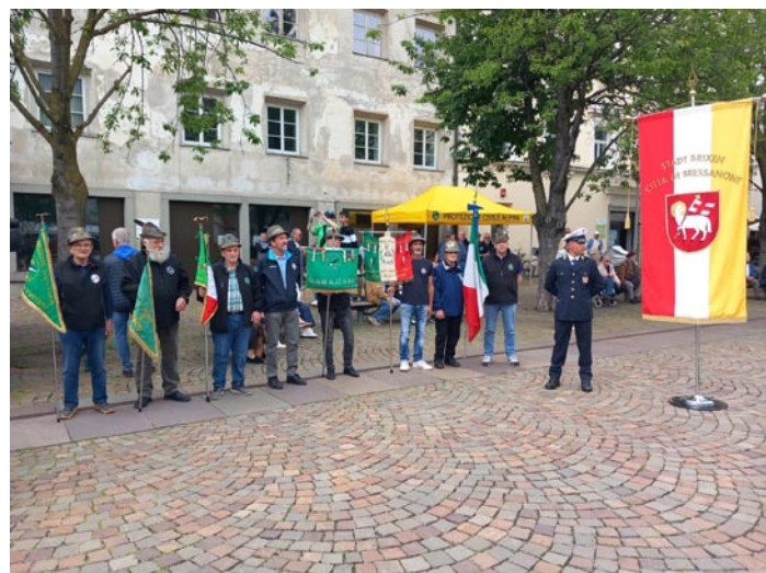
Il nostro Labaro ANCR Bressanone nello schieramento