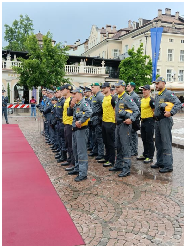
Il Reparto d'Onore della Guardia di Finanza