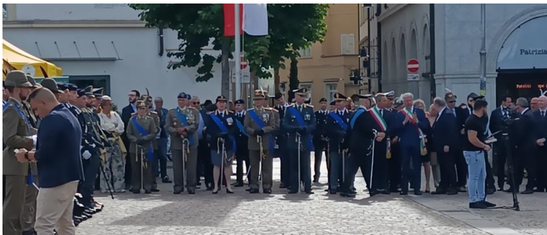
Una parte delle tante Autorità presenti