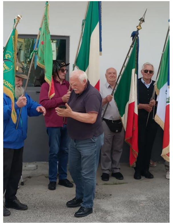
Zampini della Sezione ANCR di Fortezza e Pacher della Sezione ANCR di Vipiteno durante la deposizione delle Corone