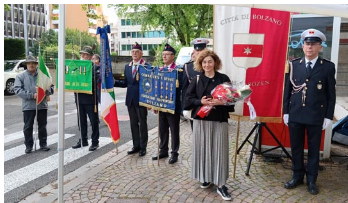
Il nostro Labaro nello schieramento e (sotto) le Autorità prima della celebrazione