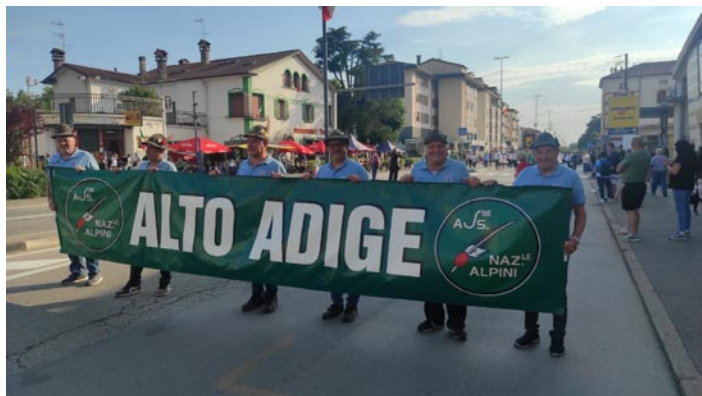
Lo striscione dell'ANA Alto Adige all'Adunata di Vicenza

10, 11 e 12 Maggio: Vicenza, 75esima Adunata Nazionale degli Alpini (presenti con membri del Direttivo di Bolzano). A questa Adunata eravamo presenti con il Vicepresidente della Federazione Regionale e Presidente della Sezione di Campodazzo. Come sempre, ritrovo festoso di ex Alpini che, tra un canto, una bevuta ed una iniezione di allegria hanno sfilato nelle vie di una Vicenza ben preparata all'evento. (Foto in rassegna).