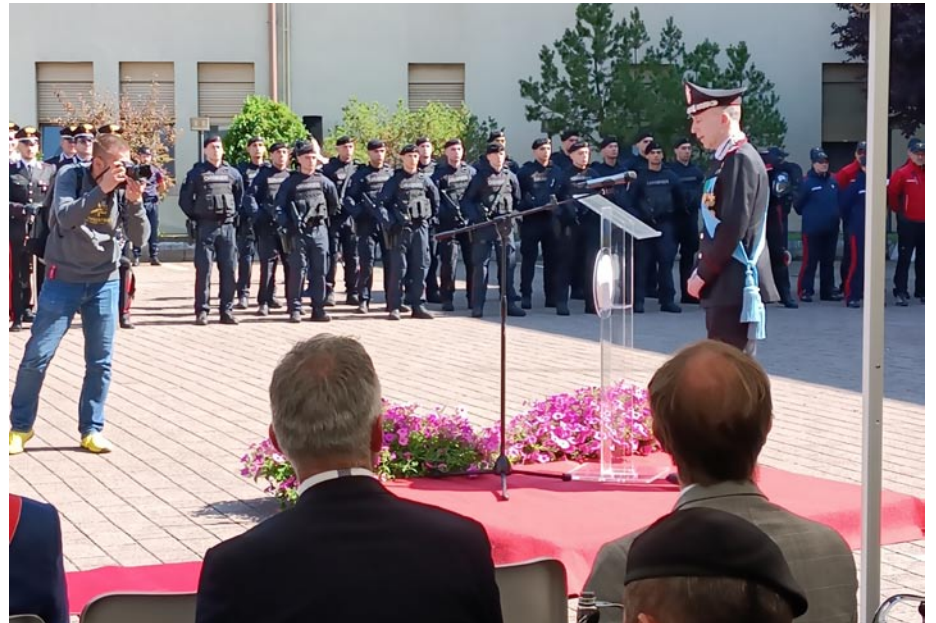
Il Comandante Legione Carabinieri Gen. Brig Riccardi durante la lettura della sua relazione

Bolzano, 5 giugno: 210° Anniversario della Costituzione del Corpo dei Carabinieri