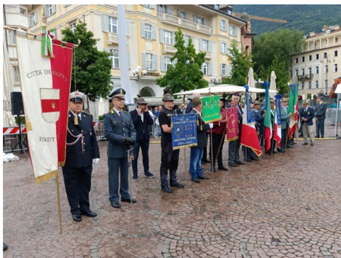
Rassegna delle Associazioni presenti