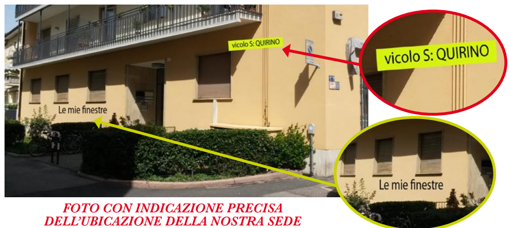
FOTO CON INDICAZIONE PRECISA DELL'UBICAZIONE DELLA NOSTRA SEDE

A piedi da ogni parte della città: ma se salite da via san Quirino o da vicolo Muri, ci troverete a sinistra all'altezza del bar che si trova di fronte a noi (si distingue per i 3 gradini all'entrata).