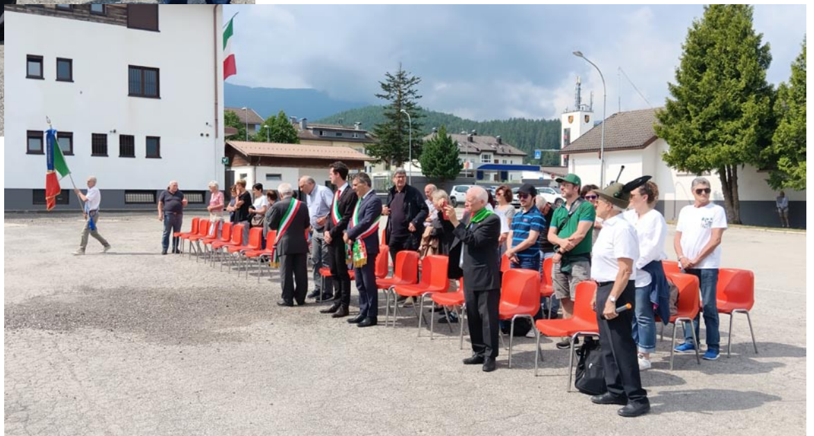
Una parte dei presenti, prevalentemente Cremonesi