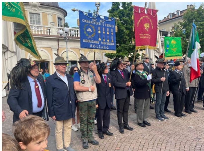
Mario col Labaro dell'ANCR nello schieramento

Diplomi ed Onorificenze a vari Militari e Civili insigniti dal Capo dello Stato. Con questo si è conclusa la cerimonia. (Foto in rassegna).