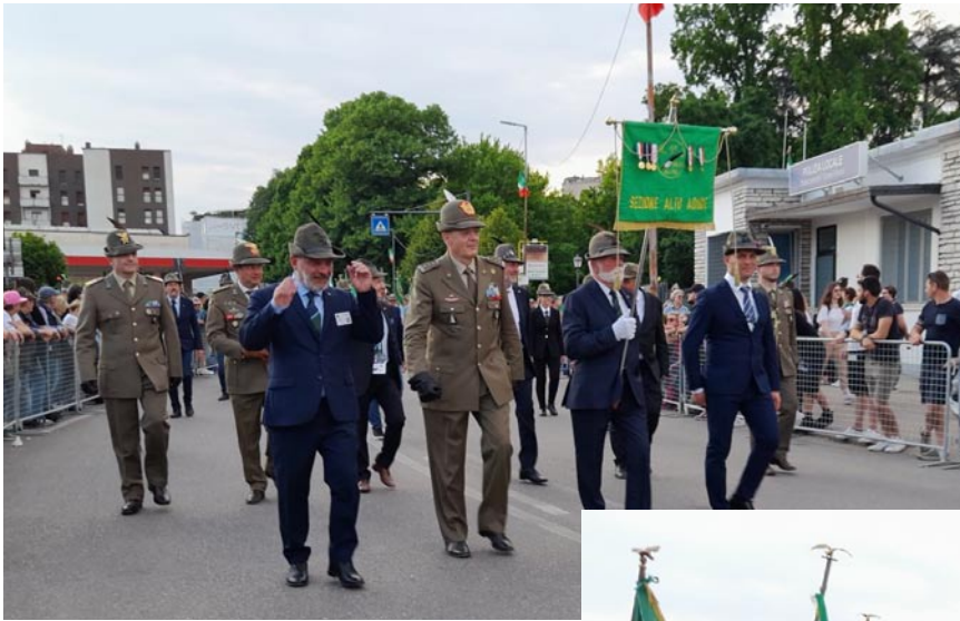
Vicenza, 10, 11 e 12 Maggio: 75esima Adunata Nazionale degli Alpini

Gagliardetti di alcuni Gruppi ANA Bolzano