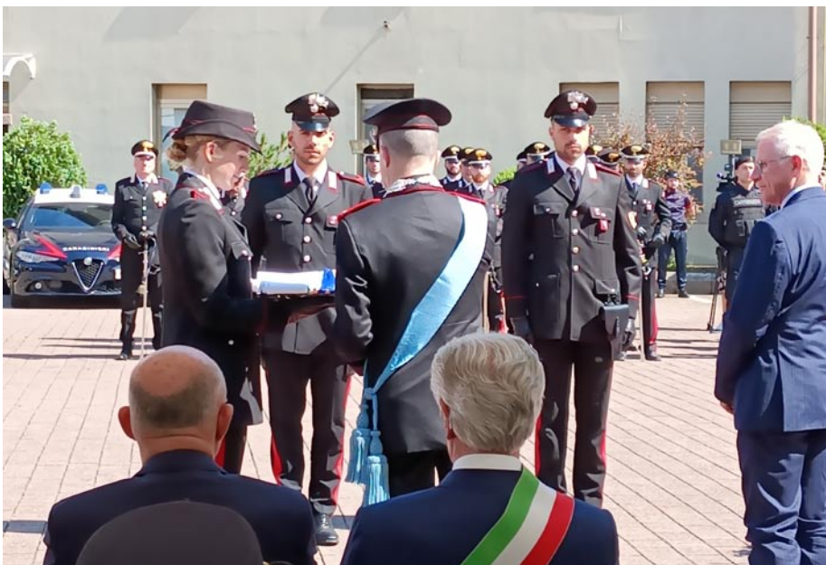
Due Carabinieri mentre ricevono gli Attestati di Benemerenzza