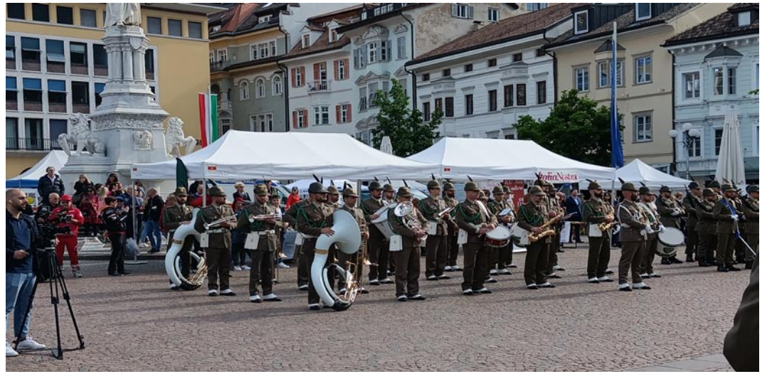
La Fanfara della Brigata Julia