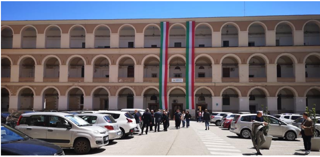
Bari, splendida architettura all'interno della Caserma "Picca" (non c'entra nulla con Bolzano, ma è architettura che mi piace)

Bolzano, 5 giugno: 210° Anniversario della Costituzione del Corpo dei Carabinieri