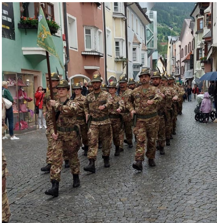
Sfilamento del 5° Alpini nelle vie di Vipiteno