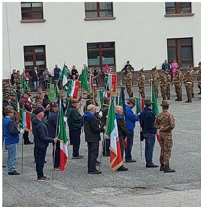
La Cerimonia in Caserma